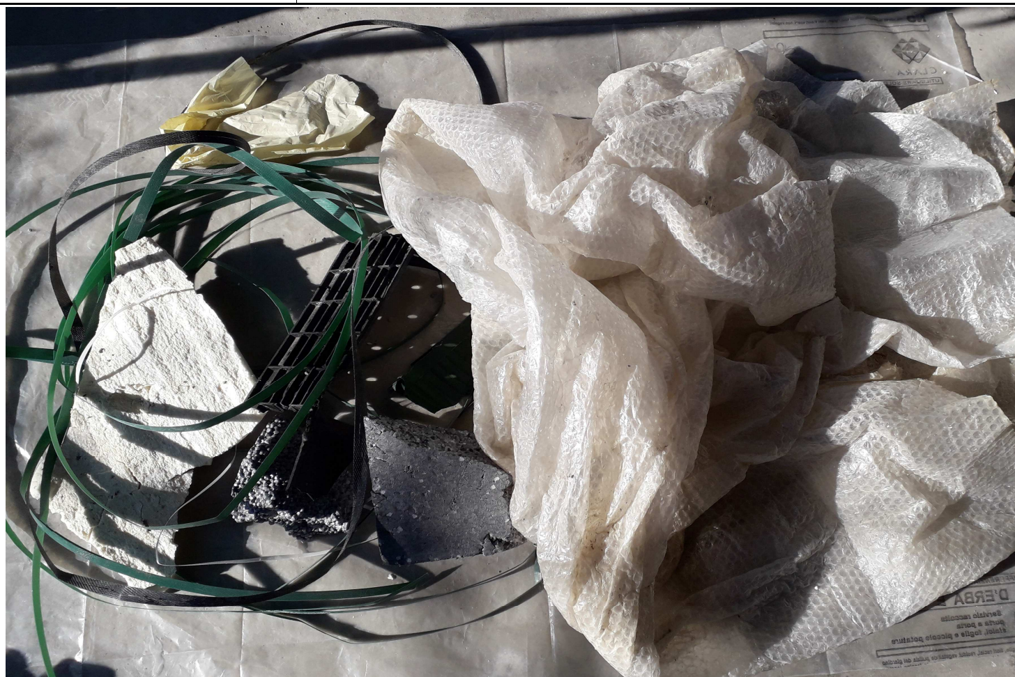
CAMPIONE MEDIO COMPOSITO