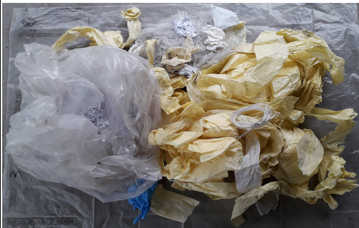
CAMPIONE MEDIO COMPOSITO