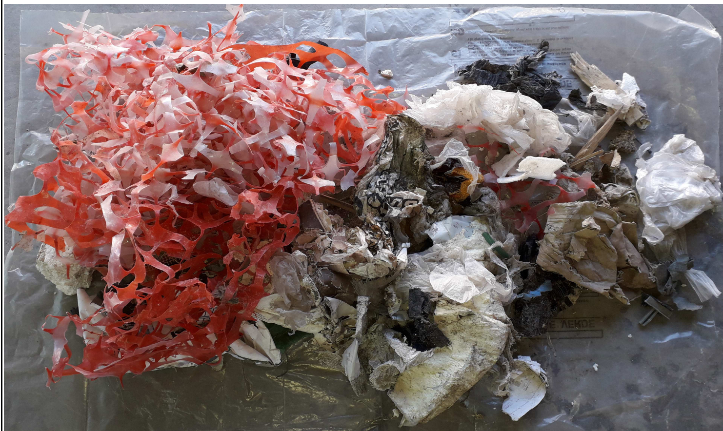
CAMPIONE MEDIO COMPOSITO