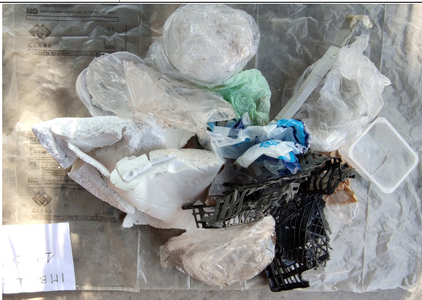
CAMPIONE MEDIO COMPOSITO