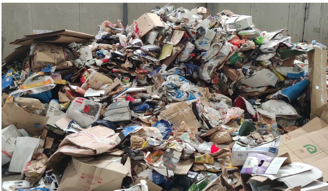
2) Campione medio composito