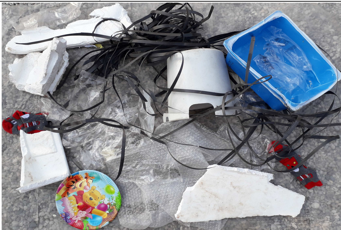
CAMPIONE MEDIO COMPOSITO